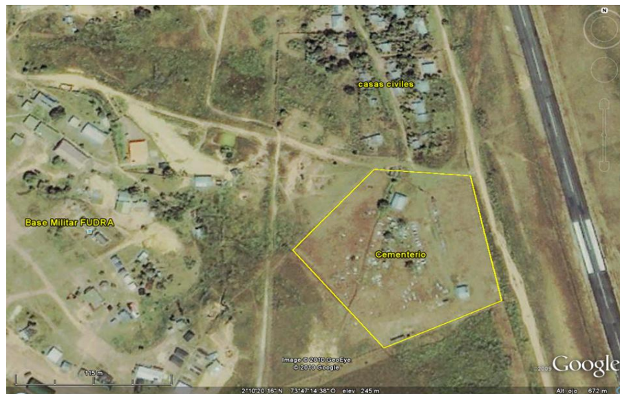
*Fotografía tomada de Google Earth el 25 de agosto de 2010. Marcaciones amarillas añadidas por la Oficina