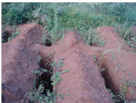
*Fotografía de la Oficina donde se pueden observar algunas tumbas excavadas en la tercera sección en 2010 y que todavía no habían sido utilizadas.

38. De acuerdo con el Ministro de Defensa Nacional, entre 2004 y 2010 la Fuerza de Tarea Conjunta Omega reportó 1.417 personas muertas en combate 30 . Es importante anotar que el cementerio de La Macarena ha recibido cadáveres de las personas reportadas como muertas en combate en dicho municipio y en otros cercanos. Fuentes militares informaron que el traslado de los cuerpos hasta La Macarena u otros cementerios de municipios cercanos obedecía, entre otros motivos, no a un criterio de jurisdicción, sino a la presencia o no de autoridades para realizar el trámite legal de inspección de cadáver, así como a las