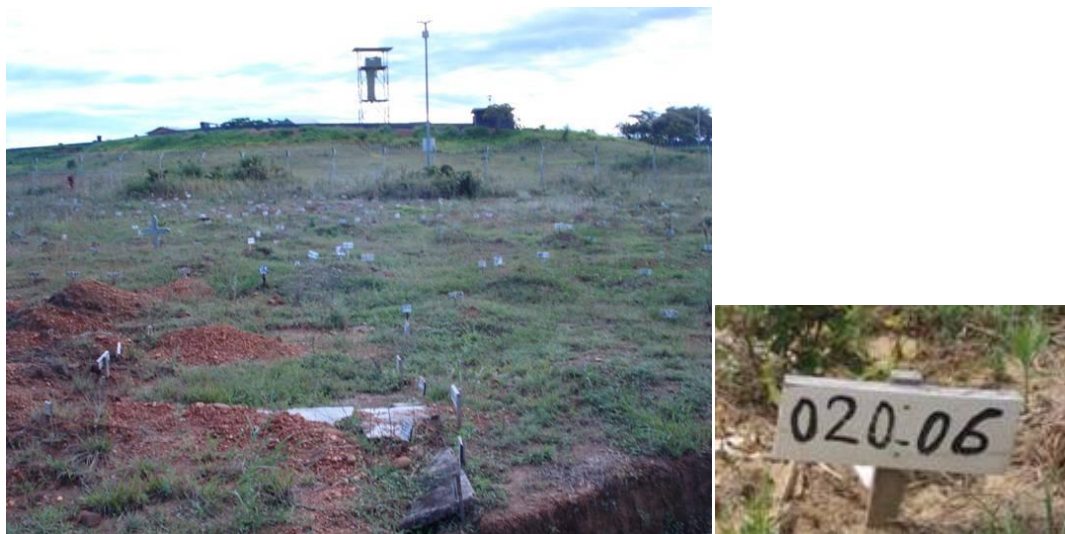
*Fotografía de la Oficina donde se aprecian tumbas marcadas.

37. La tercera sección, ubicada en la parte sur del cementerio, ha comenzado a ser utilizada a partir de 2010. Hasta los primeros días de julio un solo cadáver había sido inhumando allí.