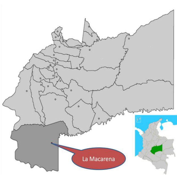
Mapa del Municipio de La Macarena 10