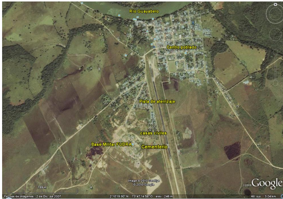
*Fotografía tomada de Google Earth el 25 de agosto de 2010